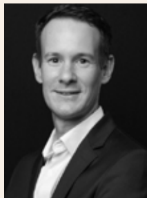
DAVID BISSEUIL COGNAC